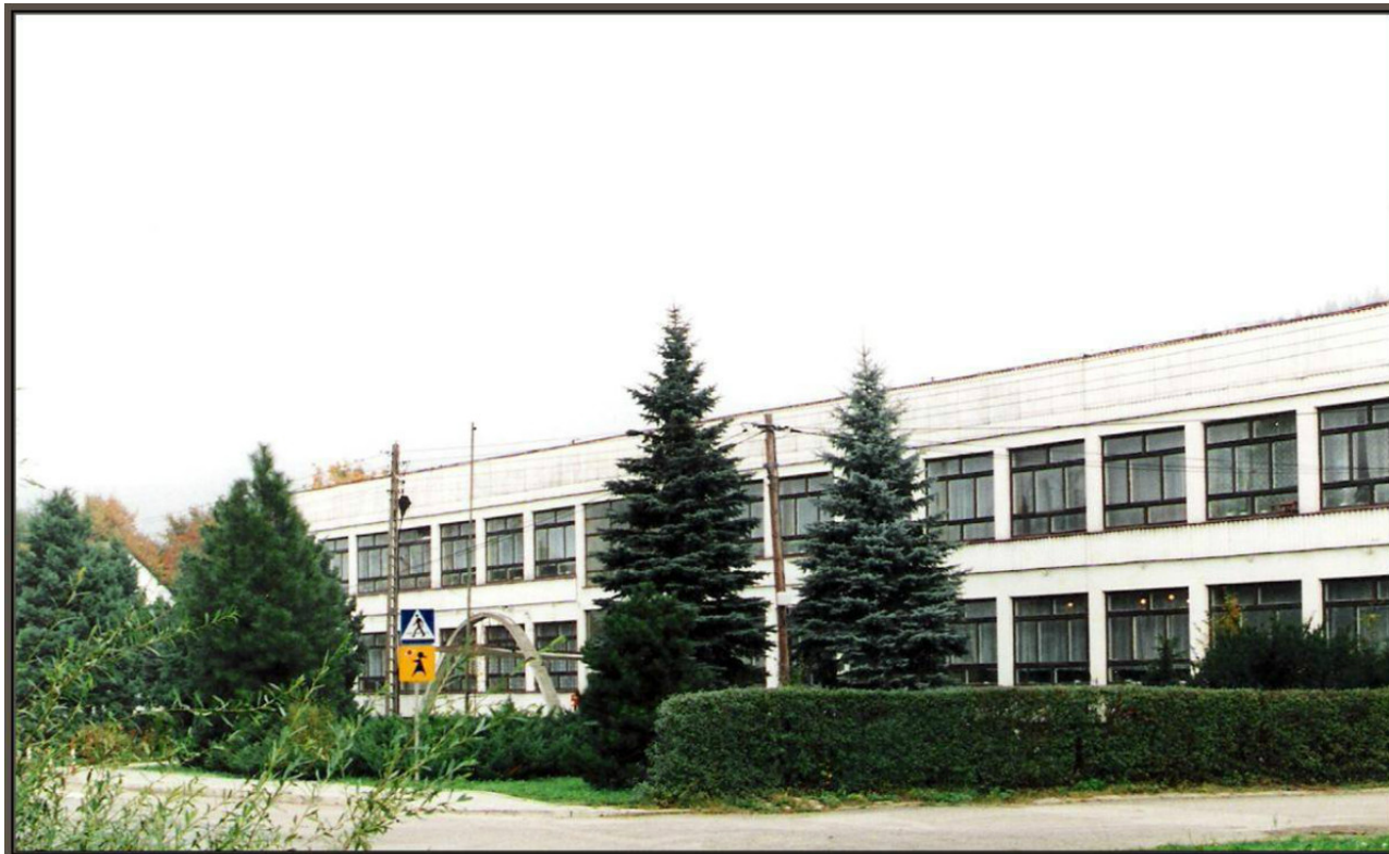
Budynek szkoły 15 lat temu

został Społeczny Komitet Budowy Szkoły w Polanie. Budowę rozpoczęto w 1967r., a zakończono w grudniu 1968r.